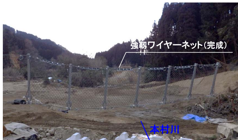
強靱ワイヤーネット(完成)