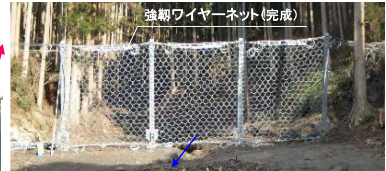
強靱ワイヤーネット(完成)