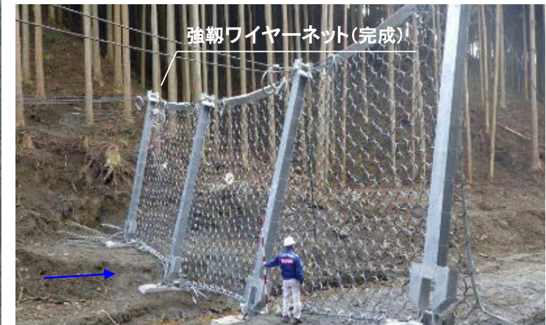
強靱ワイヤーネット(完成)