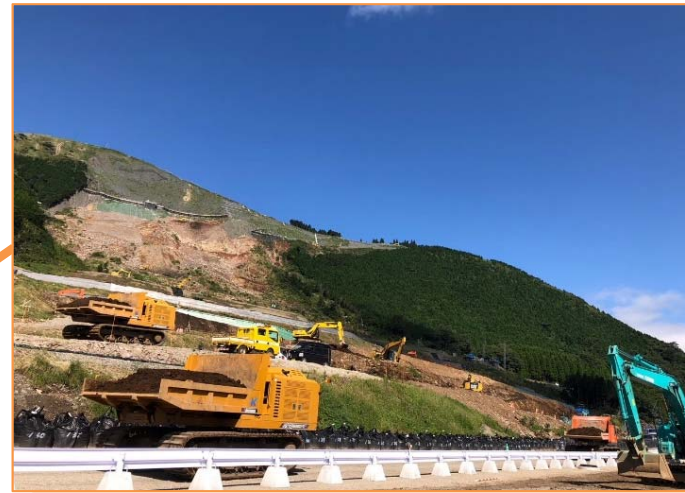
土留盛土下部:工事用ヤードとして使用中