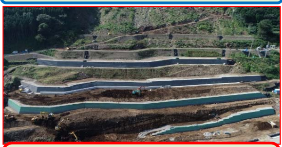
土留盛土下部(鋼製土留工):全4段のうち4段目を施工中