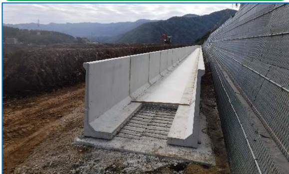
立野用水(南阿蘇村):熊本県施工中