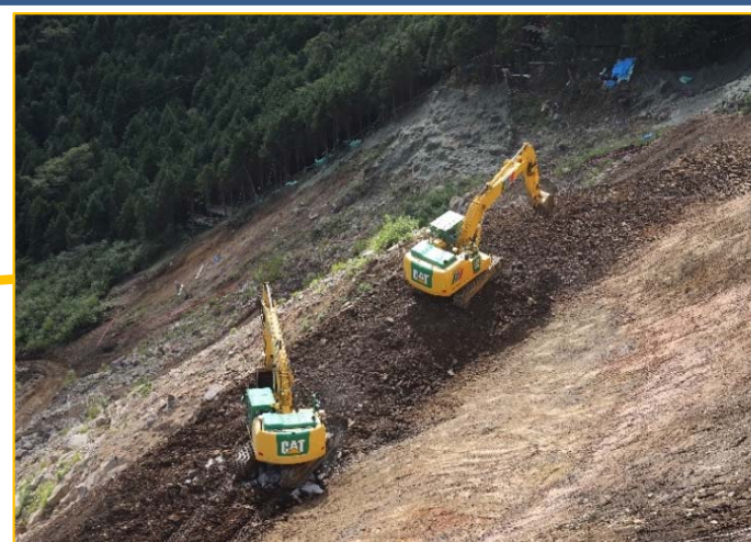
斜面中腹部:崩壊土砂等の除去、法面整形を施工中