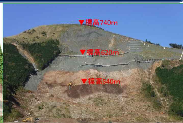
斜面上部~中腹部: 傾斜の特に急な標高620m付近まで対策完了 崩壊土砂の撤去標高540m付近施工中