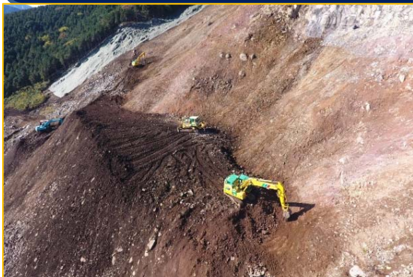
斜面中腹部: 崩壊土砂等の除去、法面整形施工中

斜面上部の傾斜が特に急な区域(標高620m以上)の対策が完了しています。9月6日より斜面中腹の立入り禁止を解除し、崩壊土砂等の除去を進めています。