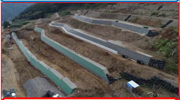
土留盛土下部(鋼製土留工):施工中