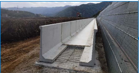
立野用水(南阿蘇村):熊本県施工中