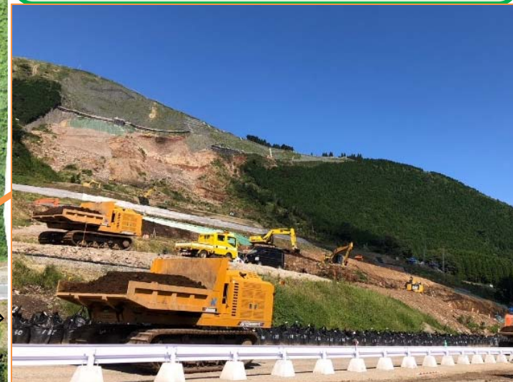
土留盛土下部: 工専用ヤードとして使用中