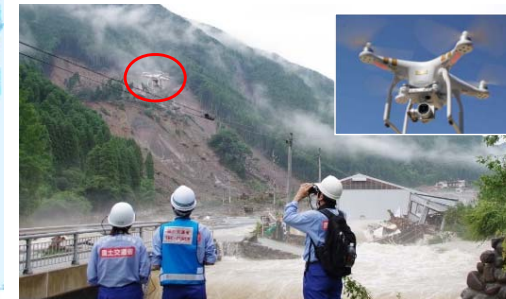
▲ TEC-FORCEによるドローン調査