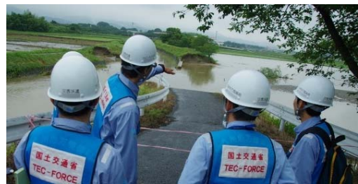
▲ 河川堤防の被災調査