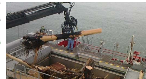
▲ 海上の流木を除去