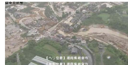
▲ 防災ヘリからの被災調査