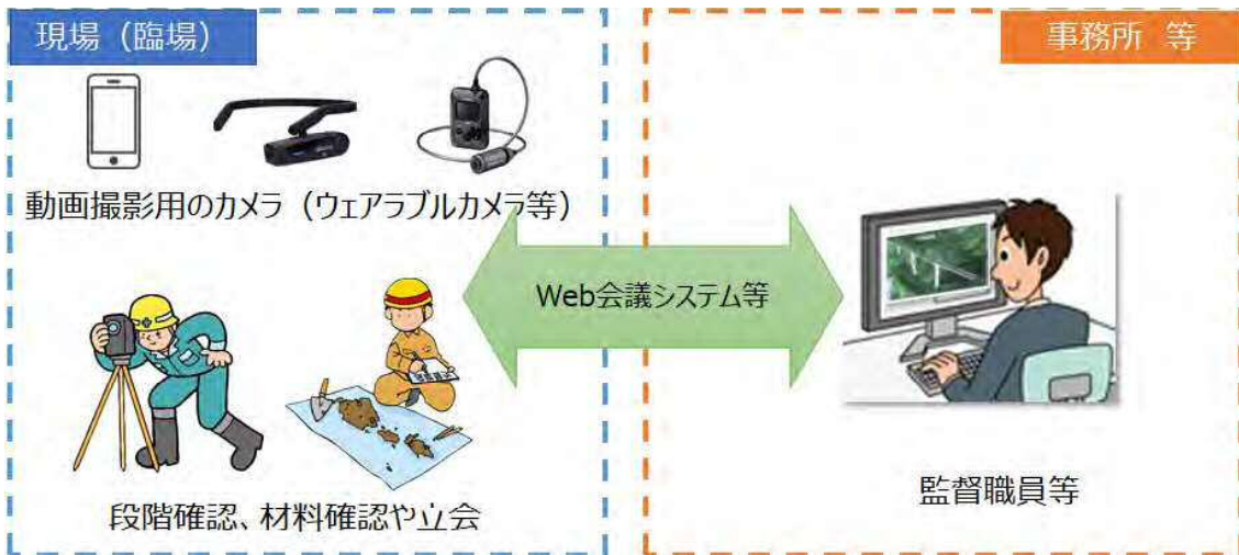
図 3-1 機器構成 (例)

なお、発注者側にて準備している動画撮影用のカメラ（ウェアラブルカメラ等）や既に使用している Web 会議システム等がある場合、また特記仕様書等に資機材準備の別途記載がある場合にはこの限りではない。