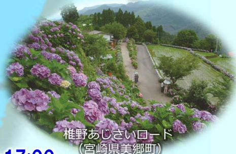
椎野あじさいロード (宮崎県美郷町)