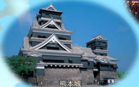
熊本城 (熊本県熊本市)