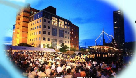
門司港レトロ地区 (福岡県北九州市)