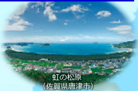
虹の松原 (佐賀県唐津市)