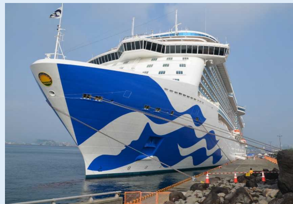
マジェスティック・プリンセス(鹿児島港)

(左)マジェスティック・プリンセス (右)ニューかめりあ(国際フェリー) (奥)クワンタム・オブ・ザ・シーズ