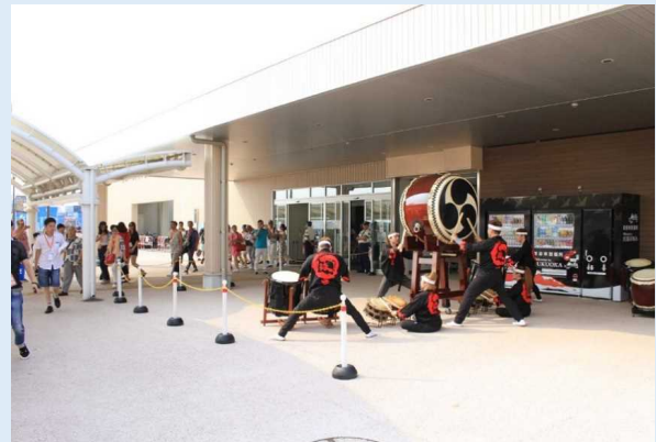
和太鼓の演奏で歓迎の様子(博多港)