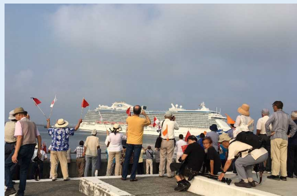
おもてなし隊手旗を振って多くの方が見送る様子(鹿児島港)