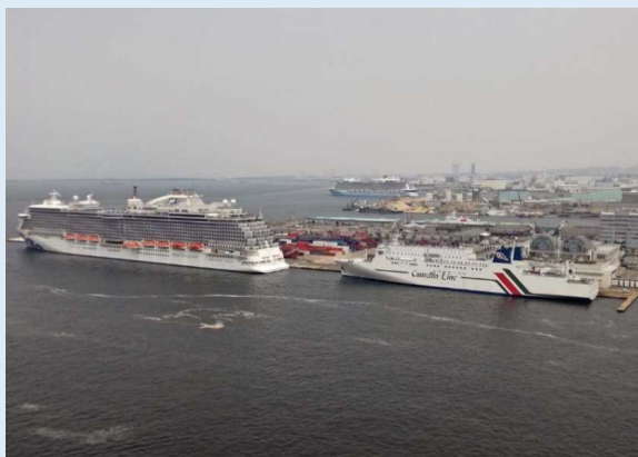
3隻同時着岸の様子(博多港)

(左)マジェスティック・プリンセス (右)ニューかめりあ(国際フェリー) (奥)クワンタム・オブ・ザ・シーズ