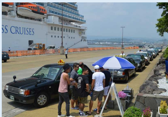
タクシーで移動する乗船客の様子(鹿児島港)