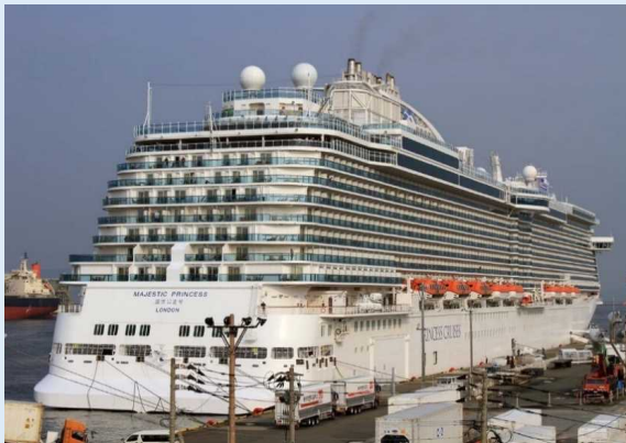
マジェスティック・プリンセス(博多港)

博多港では、クルーズ乗船客を和太鼓の演奏で歓迎し、北九州港では、吹奏楽団による演奏、鹿児島港では、「おもてなし隊手旗」を振って多くの方がお見送りしました。