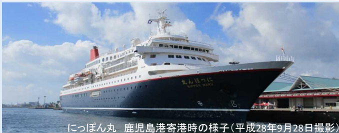
にっぽん丸 鹿児島港寄港時の様子(平成28年9月28日撮影)