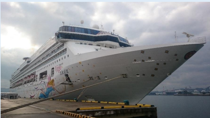
スーパースター・ヴァーゴ（佐世保港）

夕方の送迎イベントでは、地元ダンススクールの子供たちによる歌とダンスが披露され、見送りに集まった多くの市民と、デッキや客室のベランダにいる乗船客が一体となって盛り上がり、興奮冷めやらぬ中、上海へ向けて出港しました。