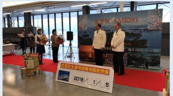
初寄港セレモニーでの花束贈呈の様子