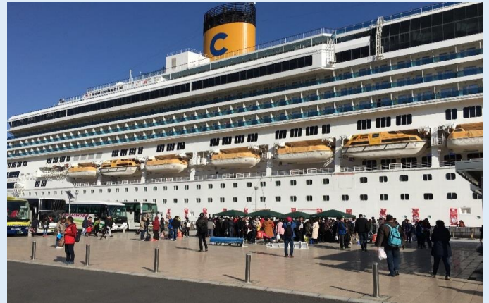
岸壁が乗船客で賑わう様子