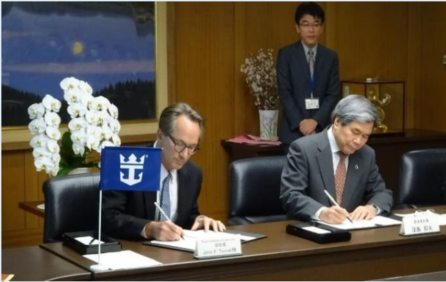
協定書への署名の様子

熊本県は、アメリカのロイヤルカリビアン・クルーズ社（RCL）と「八代港クルーズ拠点形成協定書」について、港湾法に基づく公告・縦覧の手続きを経て、平成30年2月8日に熊本県庁で八代港クルーズ拠点形成協定の締結式を執り行いました。この協定で、熊本県は、RCLに2060年3月まで年間最大150日間、八代港外港地区新岸壁の優先利用を認め、RCLは、22万トン級クルーズ船の日常の寄港に対応できる旅客ターミナルや10,000平方メートル以上の「おもてなしゾーン」を整備するとしており、官民で連携してクルーズ船寄港の促進を図ります。