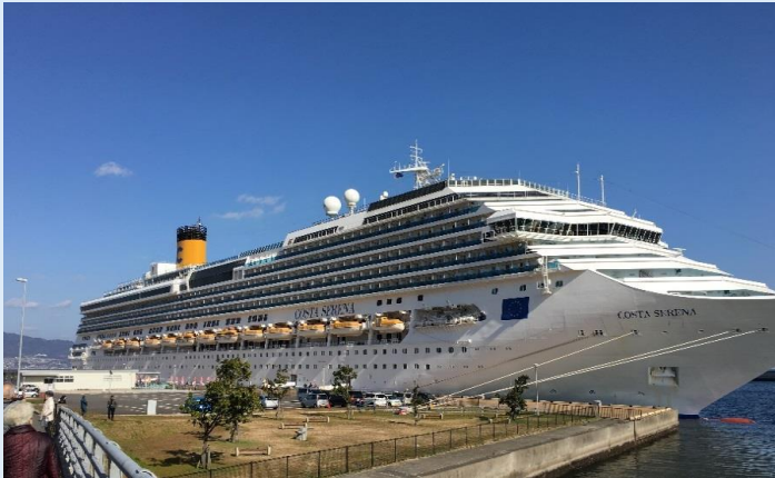
コスタ・セレーナ(別府港)

イタリアのコスタ・クルーズ社が運航するクルーズ客船「コスタ・セレーナ」(総トン数114,147ト)が、約2,800人の乗客を乗せて上海を出港し、2018年1月2日に鹿児島港を經由して別府港へ初寄港しました。