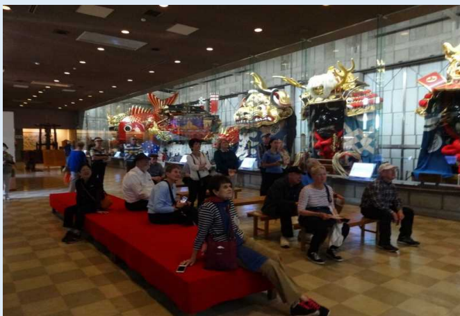
曳山展示場で曳山を観覧する乗客