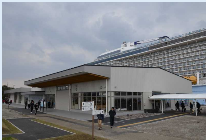
「かごしまクルーズターミナル」