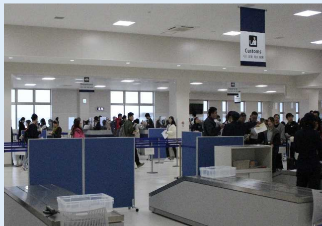
「かごしまクルーズターミナル」内の様子