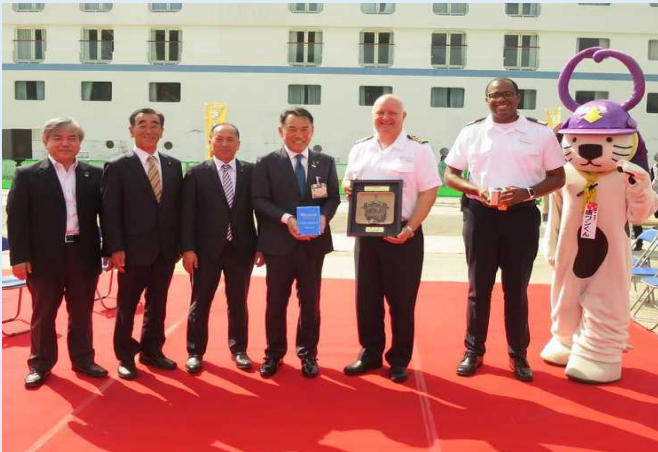
歓迎セレモニーの様子

また、唐津市中心部の商店街でも、唐津焼の器で日本酒が振る舞われるなど、大きな船では行けない小さい町ながらも、地域独自の素晴らしい観光資源にふれ合う企画もあり、旅行客は唐津の魅力を存分に満喫したとのことでした。