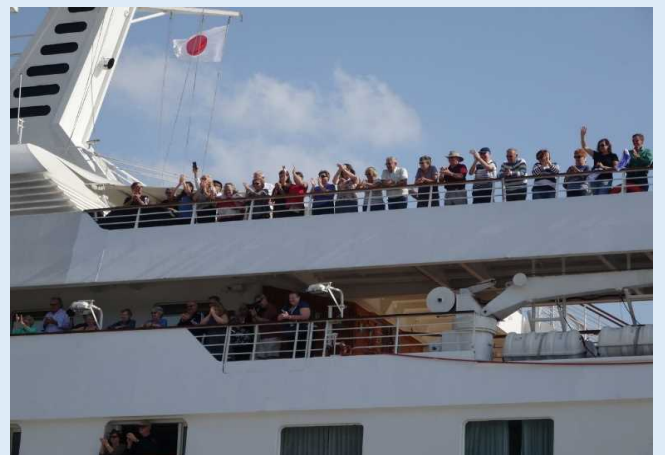
唐津港出港時の乗客の様子