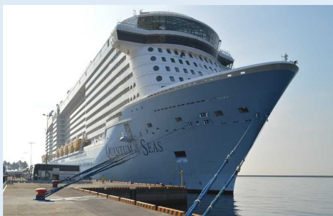
「クアンタム・オブ・ザ・シーズ」鹿児島港

また、同年4月7日には、鹿児島港の「マリポートかごしま」へ「クアンタム・オブ・ザ・シーズ」2回目の寄港があり、同日供用を開始した「かごしまクルーズターミナル」を利用しました。同ターミナルは、CIQ(税関、出入国管理、検疫)機能を備えており、今後、鹿児島港へ寄港するクルーズ船乗客の入国審査手続きが迅速化されるとのことです。