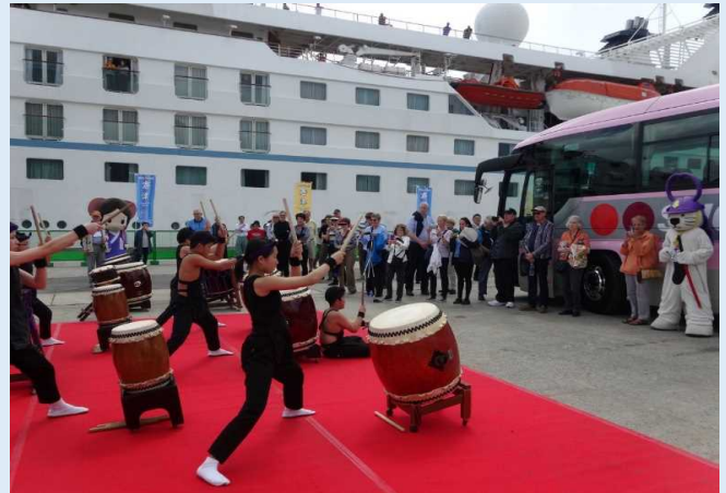
地元の和太鼓団体による演奏