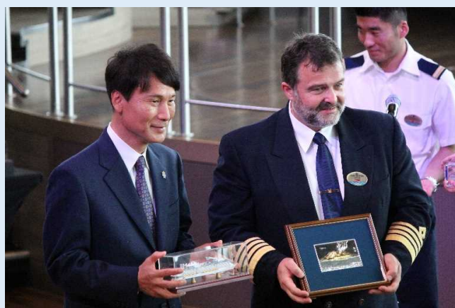
歓迎セレモニーの様子