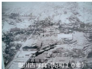
堀川古写真（昭和10年）