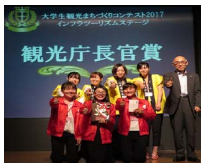
多数の地域活性化実績を誇る 跡見学園女子大学 篠原ゼミチーム