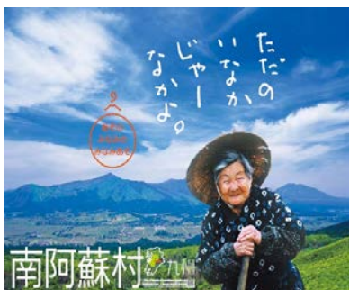
潜在的な南阿蘇村の魅力ある地域資源を創造します。

本学「篠原ゼミ」学生及びジャルパック企画担当者によるプロジェクトのキックオフ会議を5月24日(木)10:40より、本学文京キャンパスにて開催いたします。 ご多忙の折恐縮ですが、取材の場合には、 5月22日(火)正午までに、5ページ目の用紙に必要事項を記入の上、FAXにてご返信いただきますようお願い申し上げます。