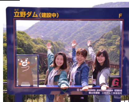
今話題のインフラツーリズム 完成を目指す 立野ダムと阿蘇の大自然が融合