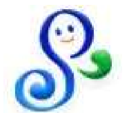
海ネットのシンボルマーク