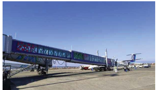
小型機対応旅客搭乗橋運用後