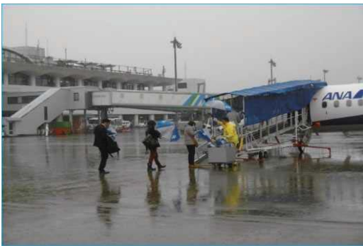
小型機対応旅客搭乗橋運用前

これまで100人乗り未満の小型機では、雨の中一旦地上に降りて徒歩やバスで移動となっていたが、研究開発を進めた結果、日本初となる小型機対応旅客搭乗橋が完成し、高齢者や体の不自由な方の不便を解消し、利便性を高めることが出来た。