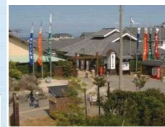
⑧「道の駅」みずなし本陣ふかえ(南島原市)