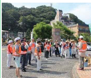
道守による清掃活動の様子