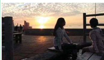
③足湯『ほっとふっと105』(雲仙市)