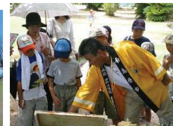
地域資源のガイドの様子