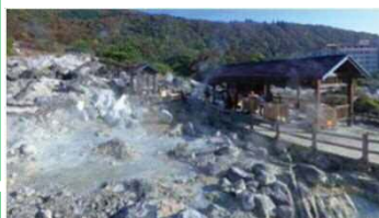
④雲仙温泉と地獄(雲仙市)