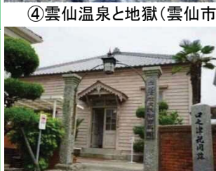
⑩口之津歴史民俗資料館(南島原市)