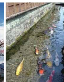
⑥鯉の泳ぐまち(島原市)