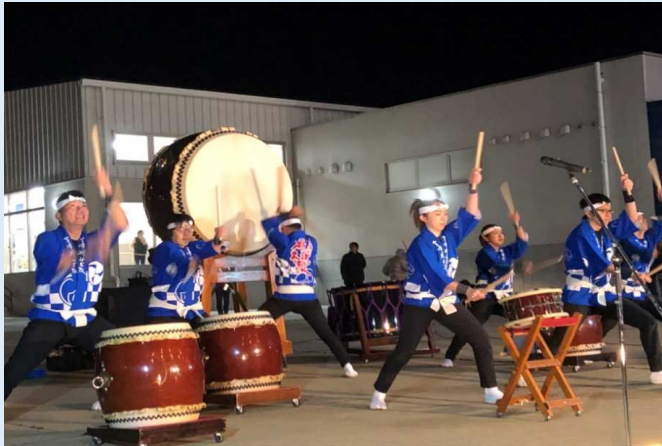
金峰権現太鼓の演奏