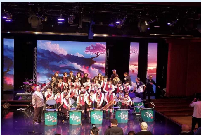
ジャズバンド「リトルチェリーズ」