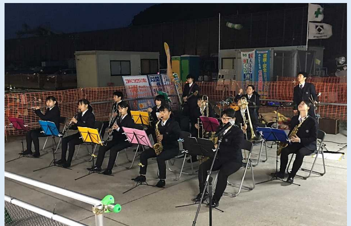
日南学園生徒による演奏