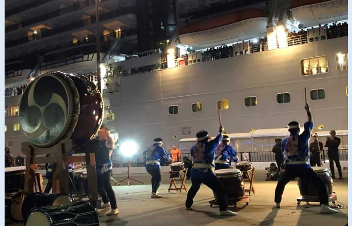
金峰権現太鼓の演奏を聞く乗客