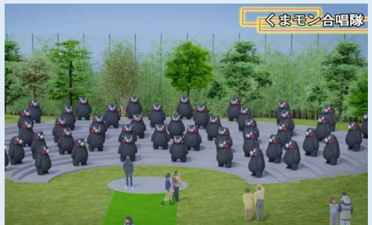
くまモン合唱隊（完成イメージ）