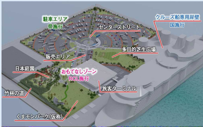
八代港クルーズ拠点 完成イメージ

（注1） http://www.pref.kumamoto.jp/kiji_28273.html