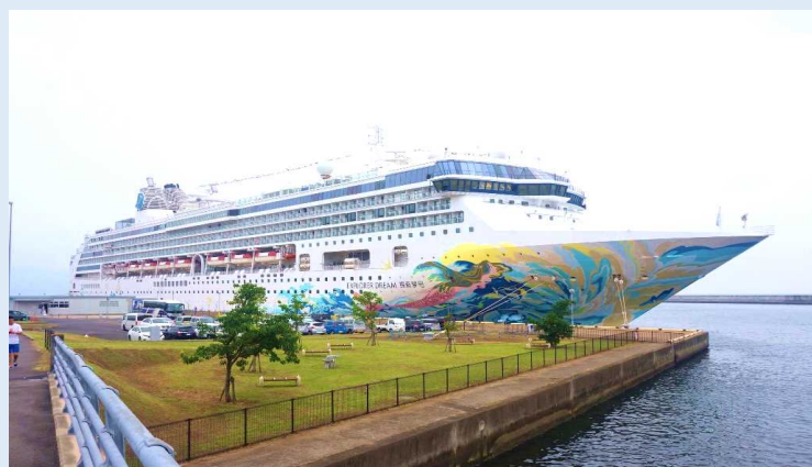
別府港に初寄港した「エクスプローラー・ドリーム」

2019年7月17日、中国のドリームクルーズ社が運航する「エクスプローラー・ドリーム」（総トン数：75,338トン）が乗客2,387人を乗せて、別府港に初寄港しました。本クルーズは、天津→下関→別府→天津の行程で、初寄港イベントでは船社へ記念品が贈られました。2019年4月から就航を開始した同船は、既に九州4港（鹿児島港、博多港、長崎港、下関港）に初寄港しています。