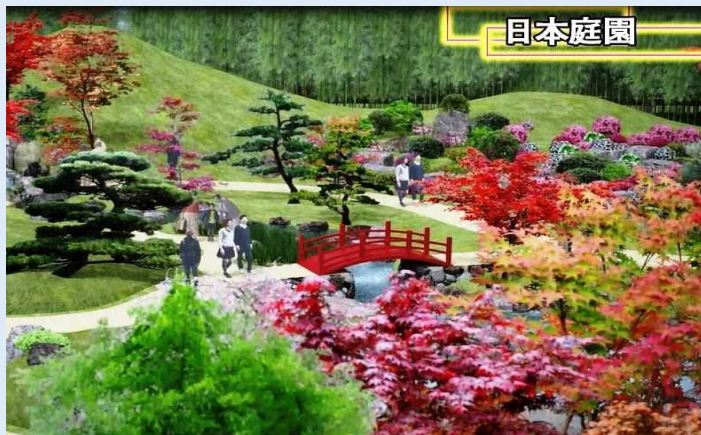
日本庭園（完成イメージ）

（左から：くまモン、ロイヤルカリビアン社 ジェームス・ボインク・ジュニア氏、熊本県 蒲島知事、九州地方整備局 神谷港湾空港部長）