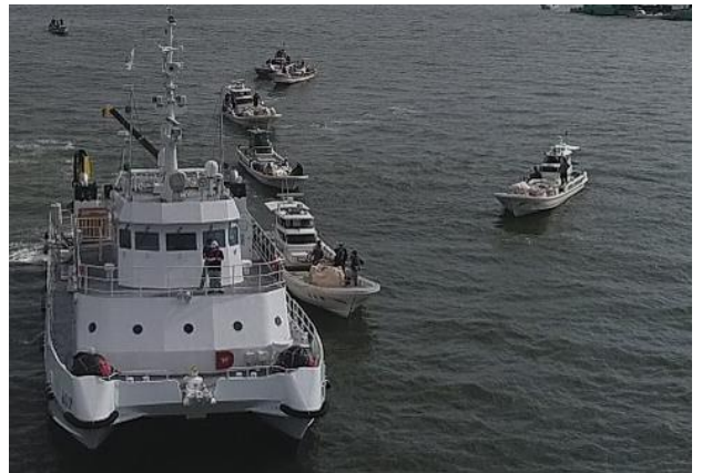
[7月22日 漁業者との連携回収]