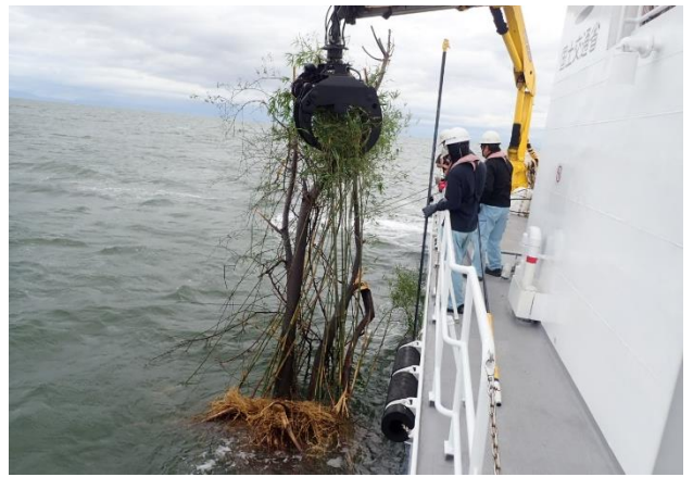
[7月10日 海輝による流木回収]