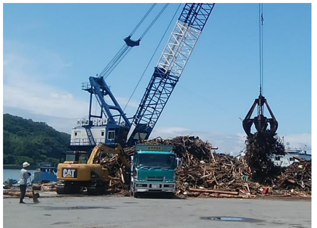
[7月26日 漂流ごみの陸揚げ]