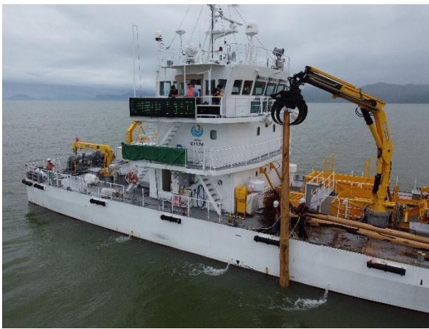
[7月5日 海煌による流木回収]