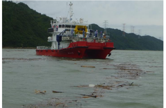
[7月13日 がんりゅうによる漂流ごみ回収]