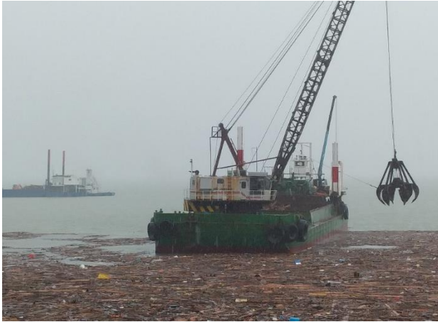
[7月11日 支援台船による漂流ごみ回収]