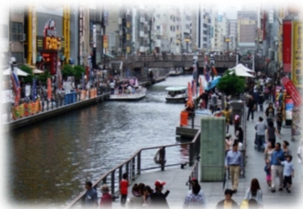
遊歩道の民間活用 (道頓堀川／大阪市)