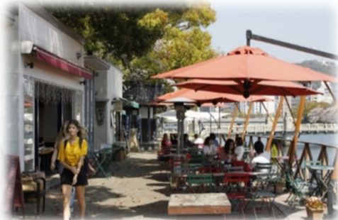
オープンカフェの設置 (京橋川／広島市)