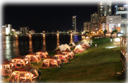
民間事業者の参加 (信濃川／新潟市)