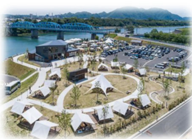
賑わい拠点の整備 (木曾川／美濃加茂市)