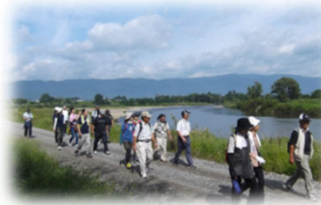
河川管理用通路の利用 (最上川／長井市)