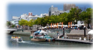
親水護岸の利用 (新町川／徳島市)