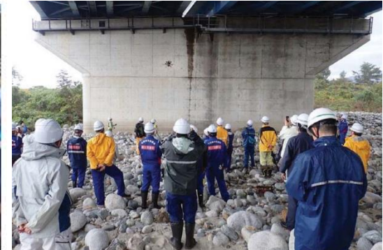
▲研修・講習会の開催 （現地講習会の実施状況）