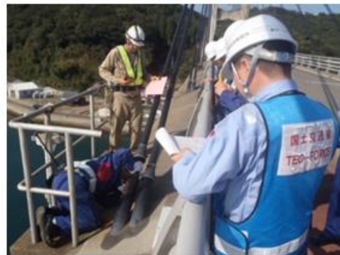
▲直轄診断・修繕代行（直轄診断状況）