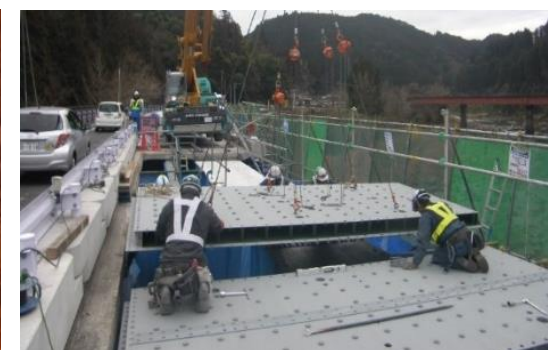
▲橋梁修繕（床版更新状況）