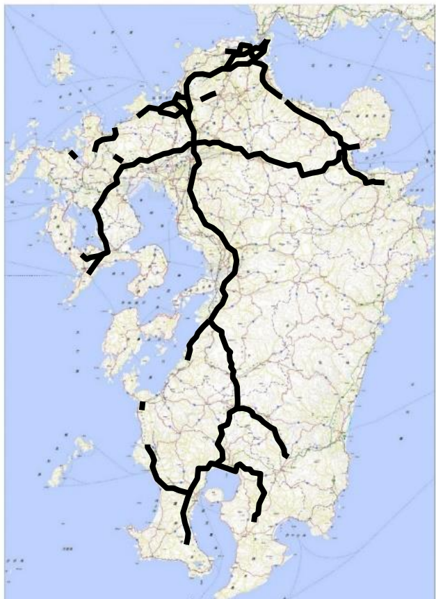
▲平成28年1月の大雪時における通行止状況