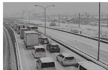
▲国道3号(三養基郡基山町)