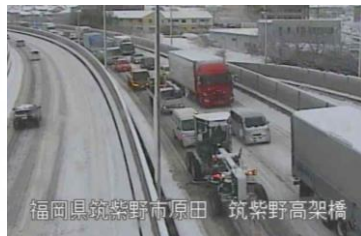
▲国道3号(筑紫野市原田)