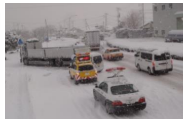
▲国道3号(鳥栖市永吉町)