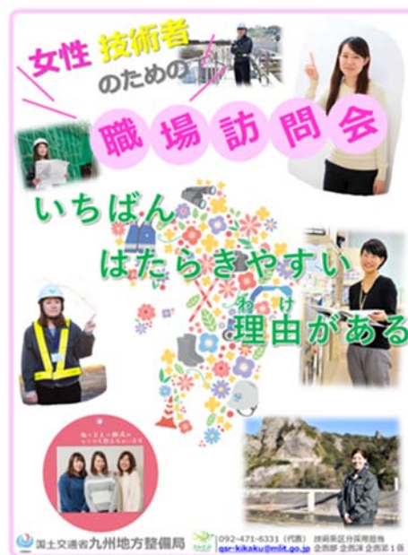
写真-5 女性技術者のための職場訪問会のチラシ

現在、現場見学会や各大学・高校・本局での業務説明会、また座談会等のリクルート活動を行っているため、女子学生が現場見学会や業務説明会に以前と比べて多くの参加となっている。また、写真-5 のように女性技術者のための職場訪問会もあわせて行っていることから女性技術者の活躍や生活をより詳細に聞けることで女子学生の入省に繋がっている。