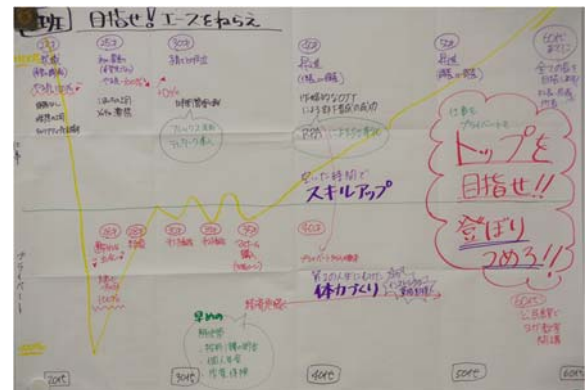
写真-3 ライフロードマップ

最後には各世代で議論した結果を発表し、課題を共有した。課題として挙げられたのは20代がコミュニケーションや技術力不足、結婚に関すること。30代と40代が仕事量と体力、心の余裕などが意見としてあった。