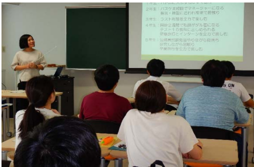
写真-2 業務説明会の様子