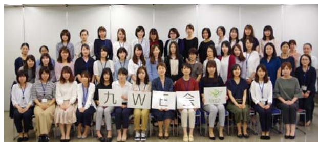
写真-1 九WE会 全体会議

九WE会という名前には、“WE”（私たちみんなで乗り越えよう）“Enjoy With”（一緒に楽しむために）という意味が込められている。設立当初は、結婚・出産・育児等をする女性技術者が働きやすくなるような取り組みを行ったり、女性技術者同士の繋がりを強化したりする活動を主としていたが、会設立から13年間の継続によりリクルート活動や土木の魅力発信などにも現在、活動の幅を広げている。