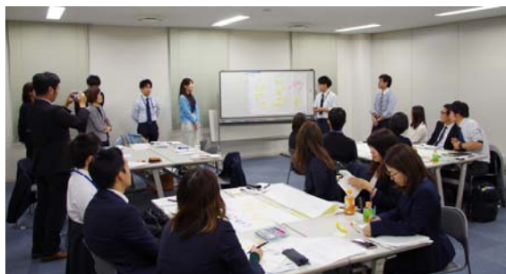
写真-4 意見交換会の様子