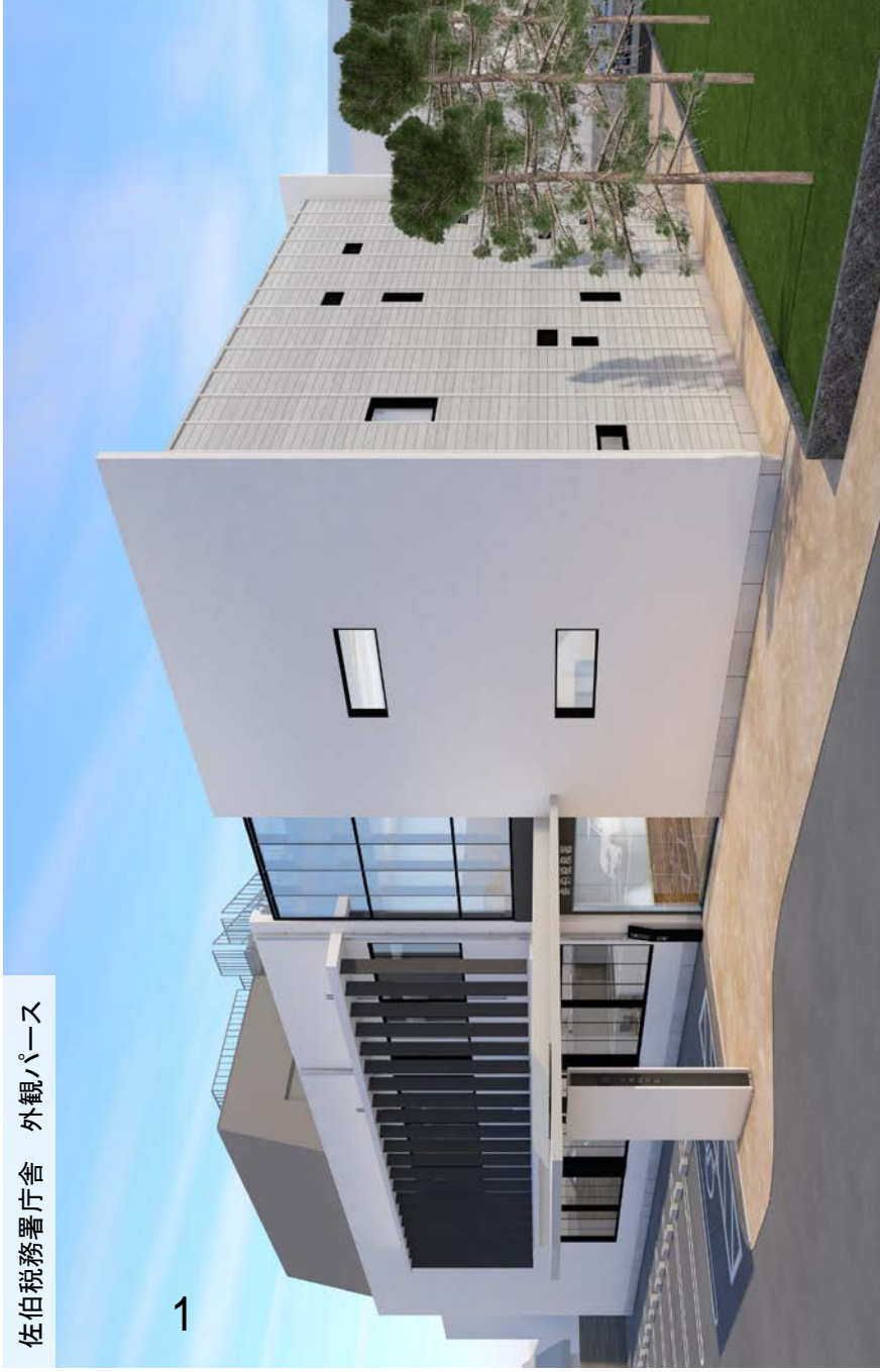
佐伯税務署庁舎 外観パース