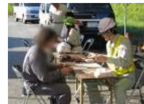
【通行許可証との照合】