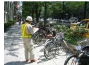
【放置自転車等の状況把握】

①道路の不正使用、不法占用等に係る指導取締り 道路区域内における未承認工事、不許可看板などの不法占用物件又は放置自転車等の状況把握、対象者への道路法等の関係法令の説明及びそれらの記録を行い報告する。