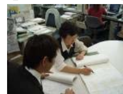
【申請書類の確認状況】

③道路法第47条の2に基づく特殊車両通行許可申請書に係る受付、特殊車両通行許可申請書の通行経路・通行車両等の確認及び許可条件付与等の審査、電算機への入力、書類の作成・整理等を行い報告する。