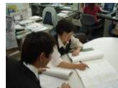
【申請書類の確認状況】

③道路法第47条の2に基づく特殊車両通行許可申請書に係る受付、特殊車両通行許可申請書の通行経路・通行車両等の確認及び許可条件付与等の審査、電算機への入力、書類の作成・整理等を行い報告する。