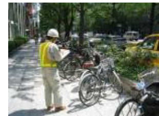
【放置自転車等の状況把握】

①道路の不正使用、不法占用等に係る指導取締り 道路区域内における未承認工事、不許可看板などの不法占用物件又は放置自転車等の状況把握、対象者への道路法等の関係法令の説明及びそれらの記録を行い報告する。