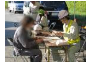
【通行許可証との照合】