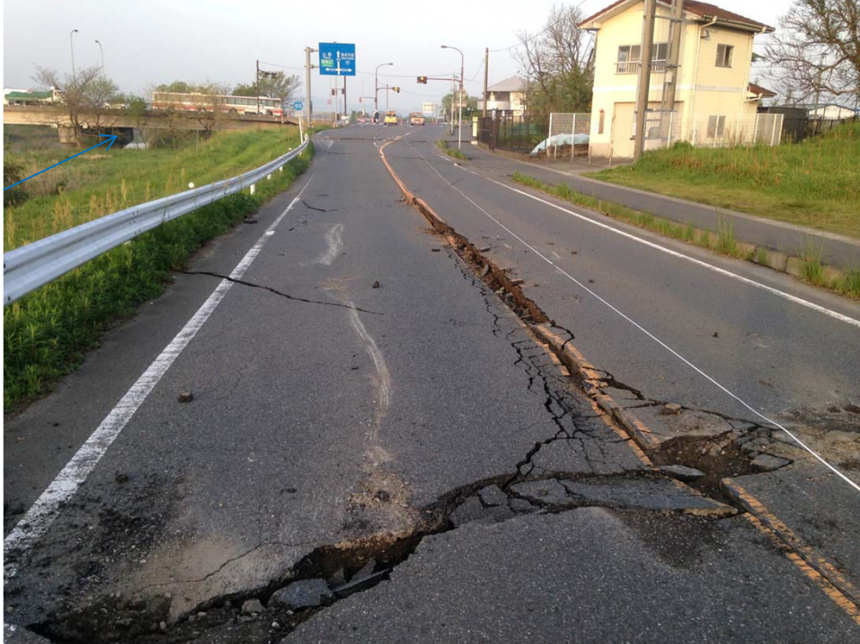
緑川水系加勢川 右岸 9k800付近