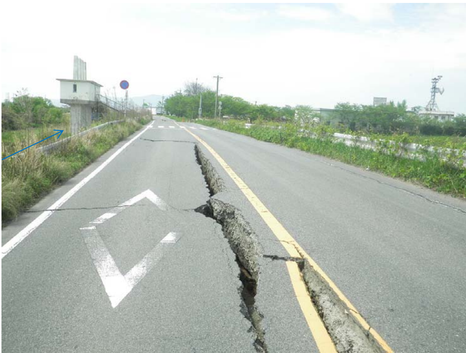
緑川水系緑川 右岸 9k200付近