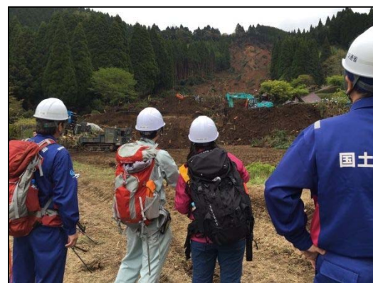
高野台地区における現地調査