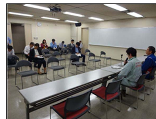
記者会見(調査結果報告)

『土砂災害現地調査チーム』のコメント ○本日の調査箇所の崩壊は、阿蘇山周辺地域では一般的な火山灰質で起こった崩壊であると考えられる。 ○今後も当該地域では余震や土砂災害警戒情報がでる場合、注意が必要である。