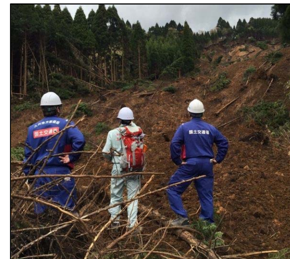
火の鳥温泉地区における現地調査