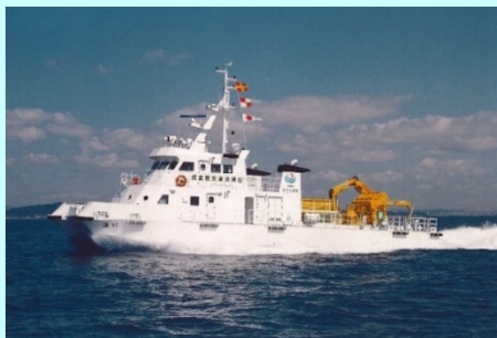
調査観測兼清掃船 海輝(かいき)