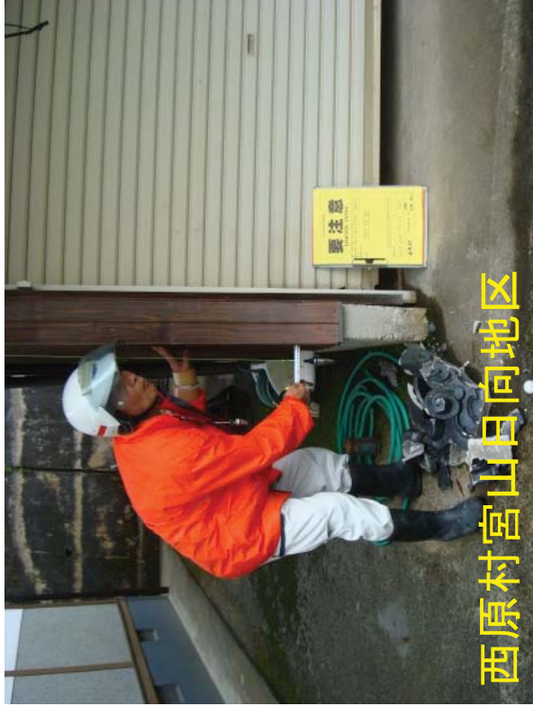
西原村宮山日向地区