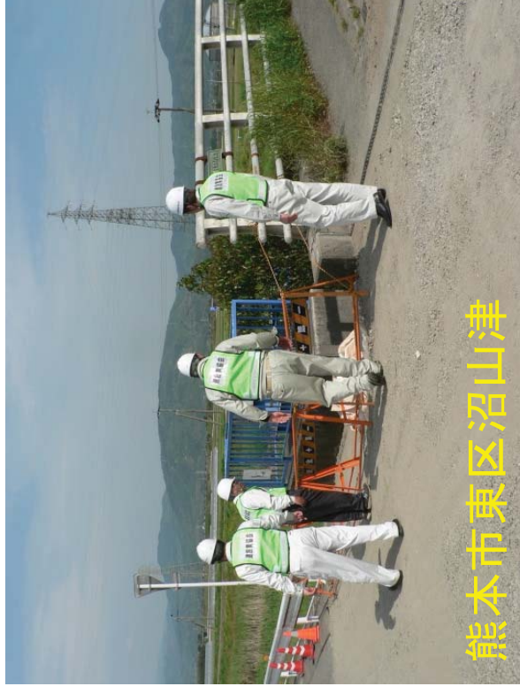
熊本市東区沼山津