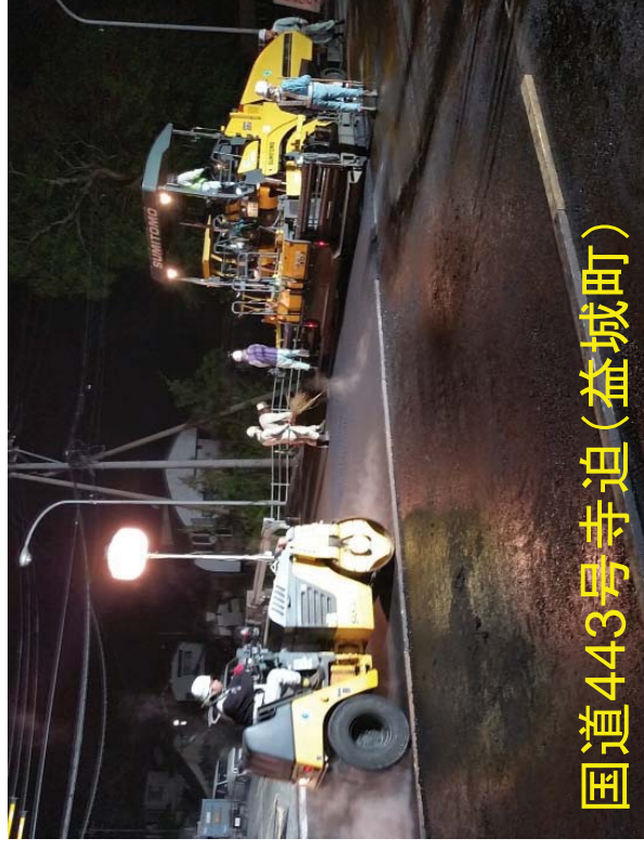
国道443号寺迫(益城町)