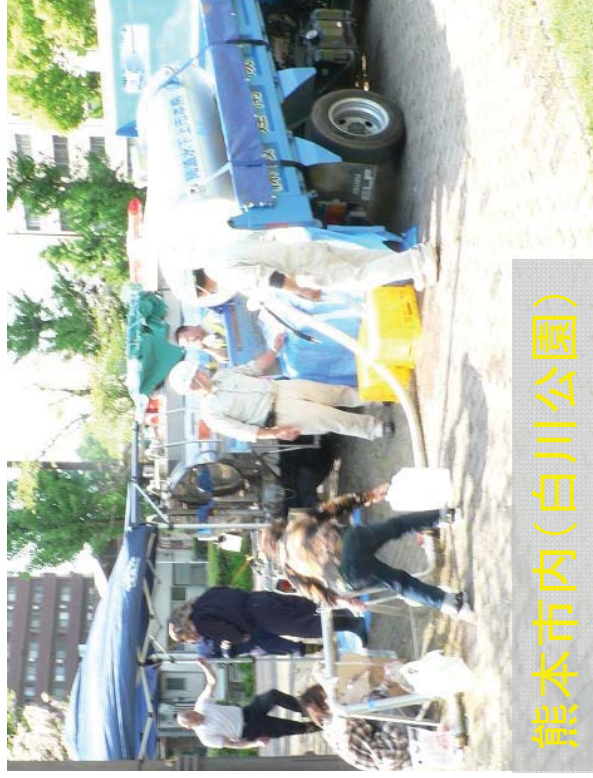
熊本市内(白川公園)