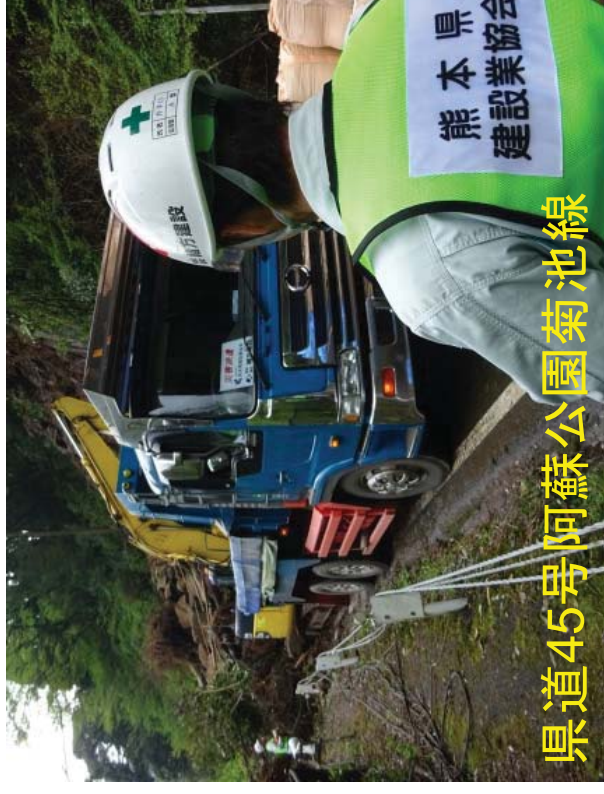
県道45号阿蘇公園菊池線