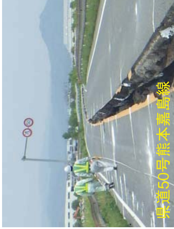
県道50号熊本嘉島線