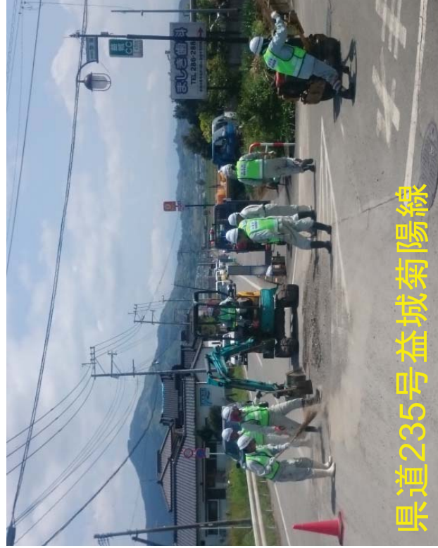
県道235号益城菊陽線