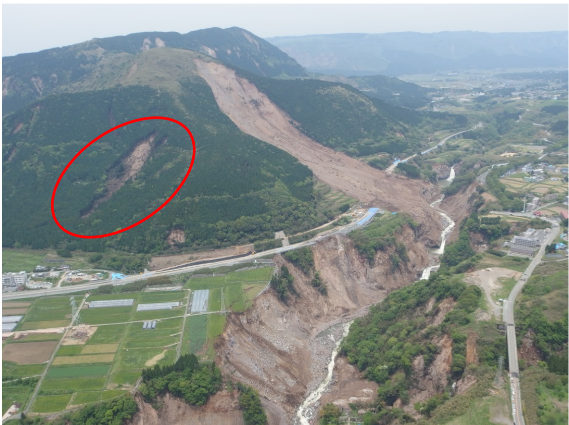
平成28年5月2日撮影画像