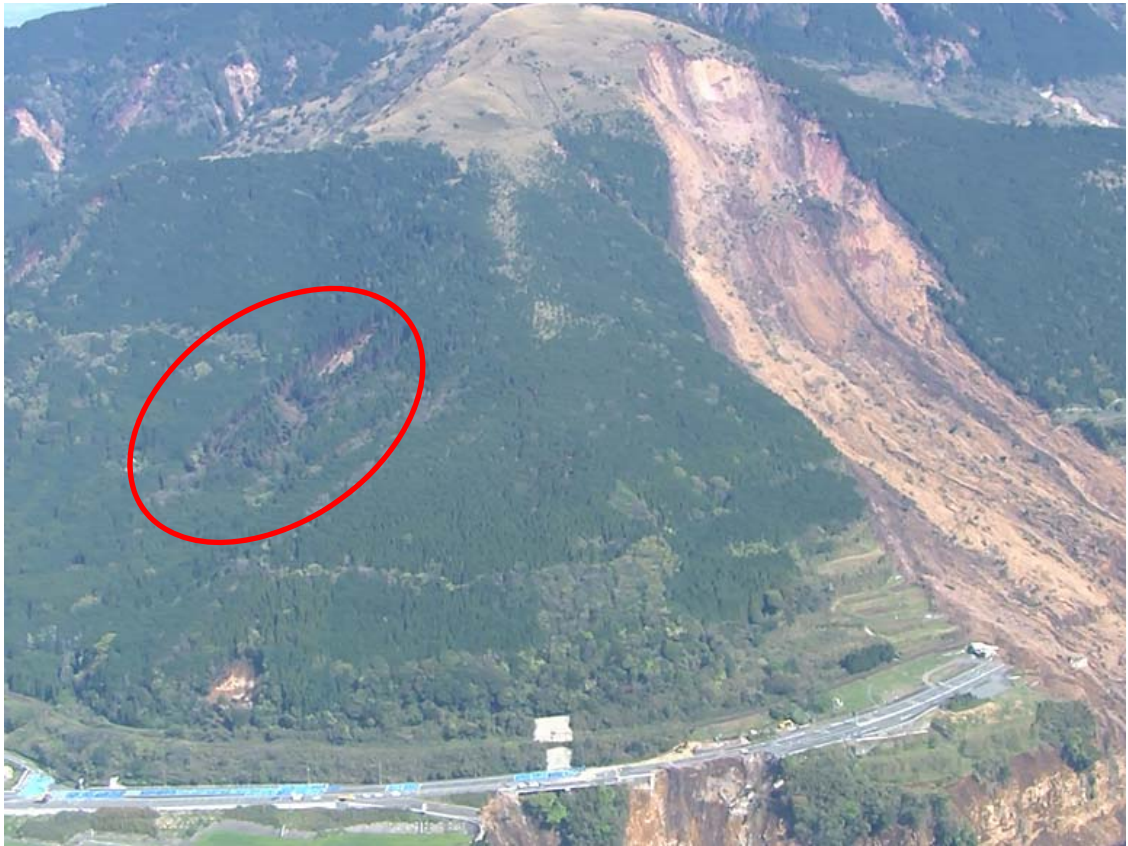
平成28年4月20日撮影画像