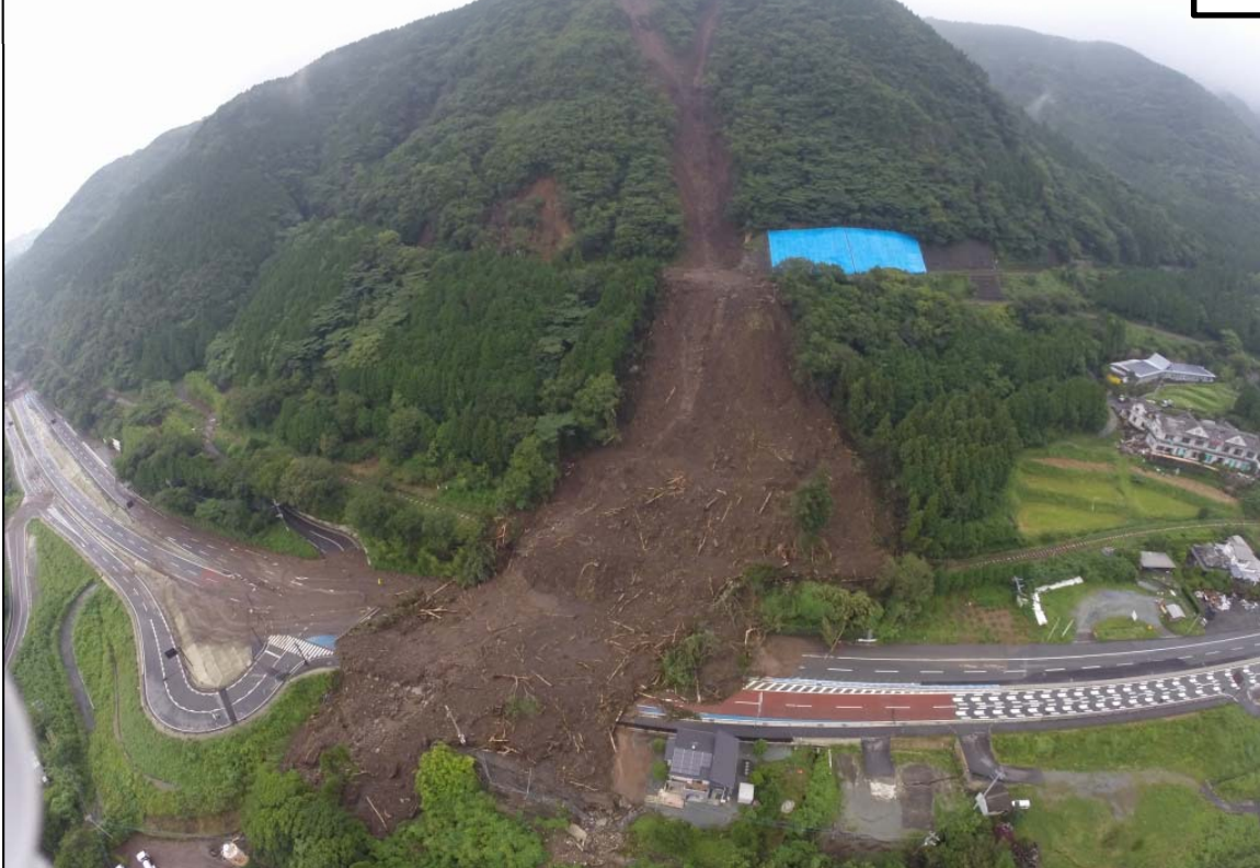
国道57号 大津町瀬田地区(85k050付近)