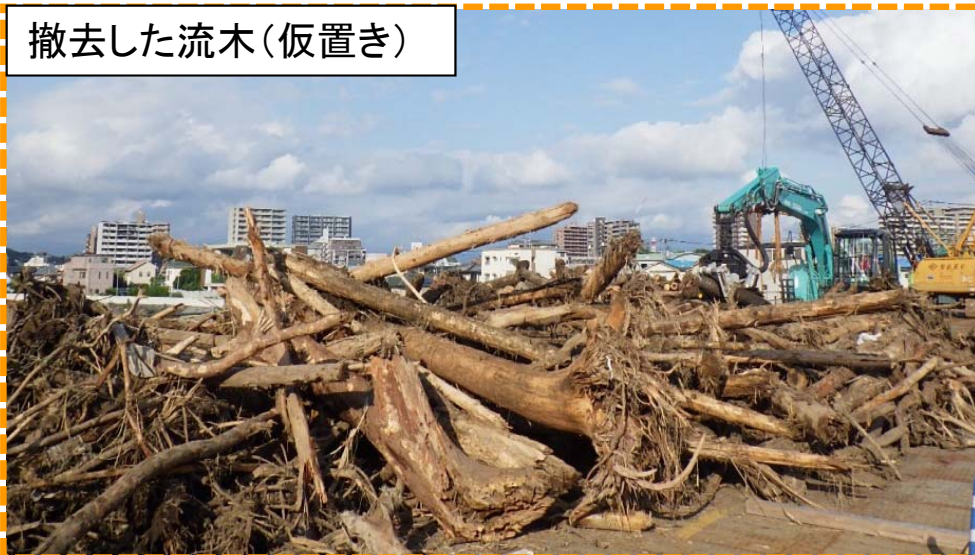
撤去した流木(仮置き)