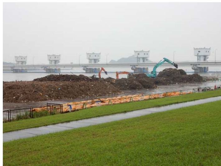
仮置き状況(6月27日撮影)

ゴミの多くは草木類です。その他ペットボトル、発砲スチロール等の生活ゴミですが、様々な種類のゴミが混在しています。