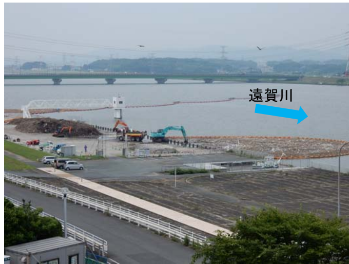
全体を望む(6月27日撮影)