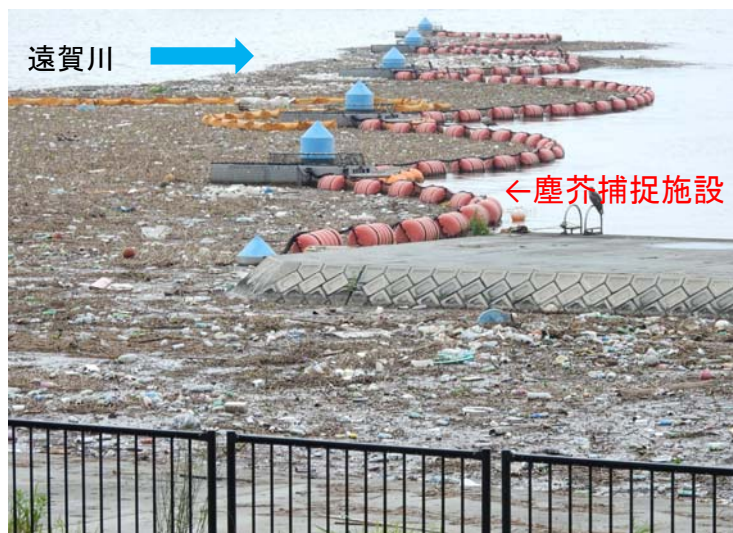
塵芥捕捉施設状況(6月24日撮影)

6月19～23日の大雨によって、遠賀川河口堰に大量のゴミが流れ着きました。28日までに、 約2,000m 3 の陸揚げ作業を行いました。これは小学校のプール(25m×10m×1m)8杯分にあたり、過去3カ年に回収した年平均量相当になります。ゴミをそのまま放置すると、水質など河川環境の悪化、河口堰ゲートへの損傷や操作の支障となります。また、海岸への流出の恐れもあるため回収を迅速に行っています。 今後、約1ヶ月をかけて、陸揚げしたゴミを手作業にて分別し処分を行う予定です。