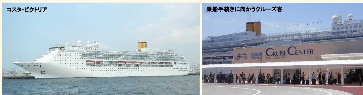
【クルーズコース】博多～舞鶴(京都)～金沢～境港(松江)～釜山/韓国～博多

イタリア船籍のクルーズ客船「コスタ・ビクトリア」(75,166ト)が、7月下旬から9月中旬にかけて、博多港発着・5泊6日で日本海を周遊するクルーズを連続で実施しました。日本海をめぐる連続周遊クルーズは大手外国船社では初めての事です。8月の発着実績は、下表のとおり。