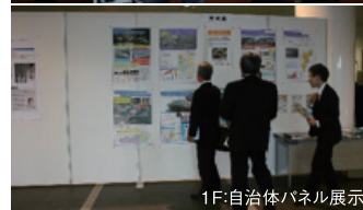
1F:自治体パネル展示