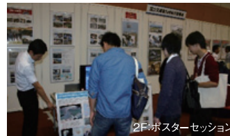
2F:ポスターセッション