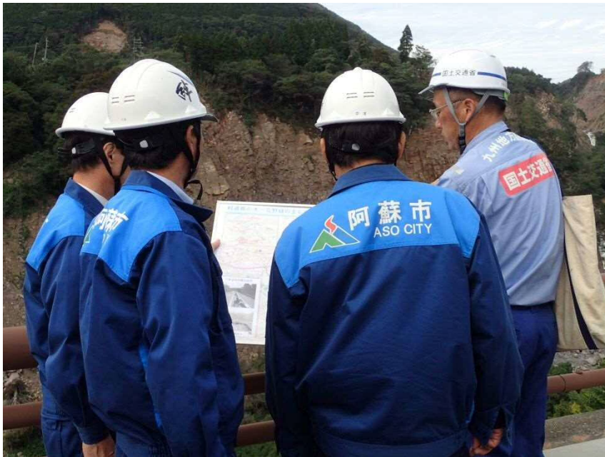
貯水池周辺斜面の視察の様子