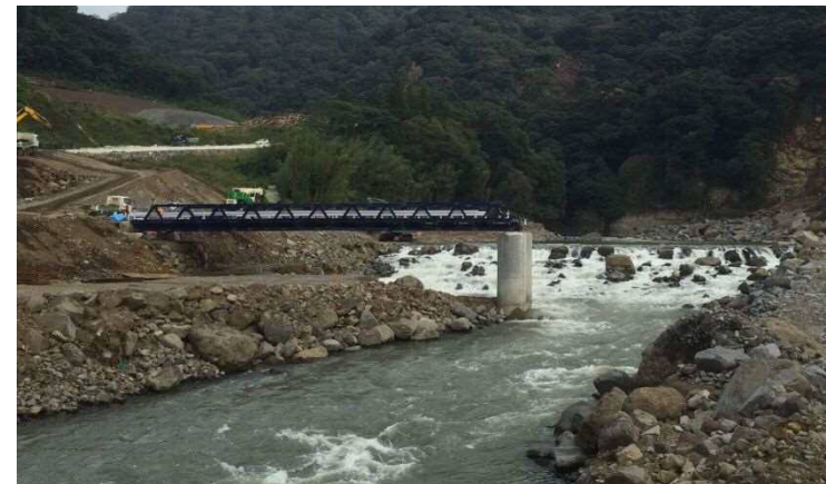
橋梁再架設後の状況