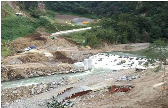
橋梁再架設前の状況