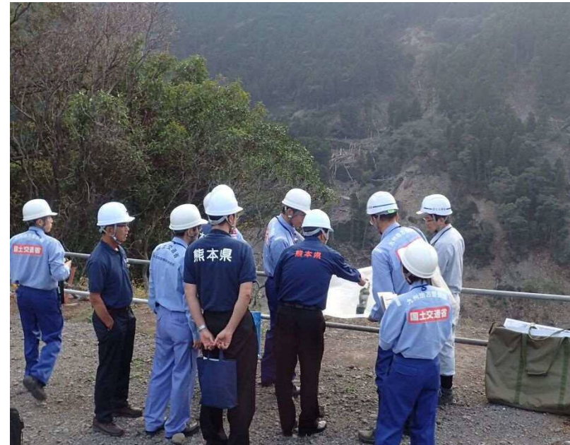
ダムサイトの視察の様子