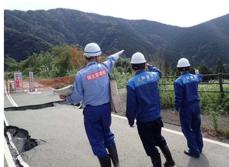
地表亀裂箇所視察の様子