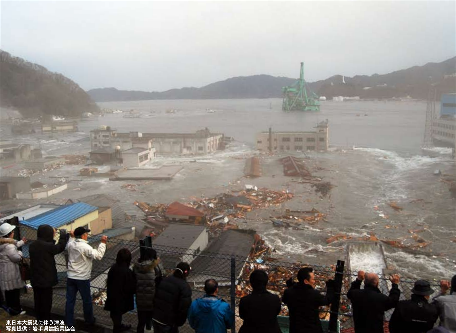
東日本大震災に伴う津波