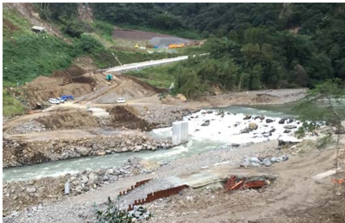
工事着手前の状況