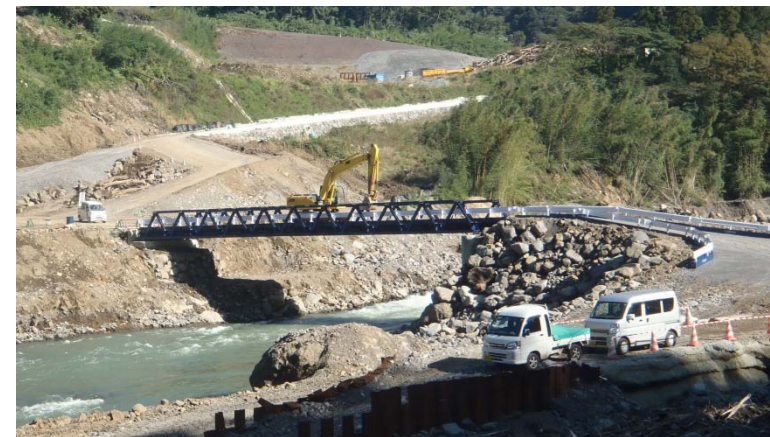
工事用仮橋復旧状況