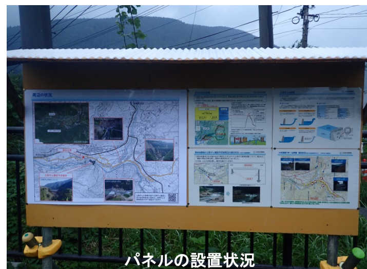
パネルの設置状況