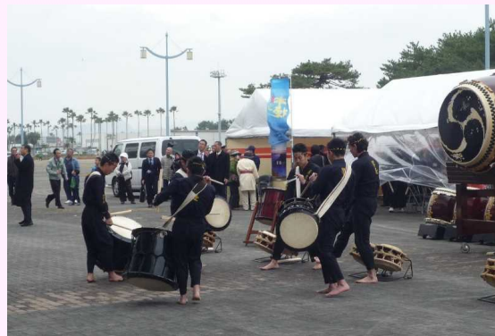
「橘太鼓 響座」による太鼓演奏