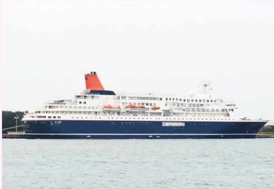
今年初寄港した「にっぽん丸」(宮崎港)

宮崎市の宮崎港に1月5日、日本船社のクルーズ客船「にっぽん丸」(22,472ト)が寄港しました。宮崎県内で国内外クルーズ客船が寄港する代表的な港湾は宮崎港以外にも油津港、細島港とありますが、宮崎県内へ今年初めてクルーズ客船が寄港したのは、他港に先駆け、宮崎港となりました。「にっぽん丸」にとっても今年初の国内周遊クルーズであり、神戸港出港後、宮崎港へ寄港しました。宮崎港へ寄港した際は、集まった県民が手を振って迎え、花束贈呈や「橘太鼓 響座」による力強い太鼓演奏などの歓迎セレモニーもあり、乗客約380名は写真を撮ったり、拍手を送ったりして楽しんでいました。下船した乗船客らは、宮崎神宮や江田神社、堀切峠などを巡る各コースに分かれ、宮崎市内を5時間ほど観光後、「にっぽん丸」は次の寄港地、広島県の尾道糸崎港へ向け出港しました。