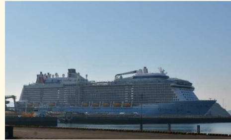
今年の元旦に八代港へ寄港した「クァンタム・オブ・ザ・シーズ」

新年幕開けの日となる1月1日、日本へ寄港するクルーズ客船としては最大級となるロイヤル・カリビアン・インターナショナル社の「クァンタム・オブ・ザ・シーズ」(168,666ト)が熊本県の八代港へ、長崎重工業長崎造船所で建造されたプリンセス・クルーズ社の「サファイア・プリンセス」(115,875ト)が長崎港へ、昨年7月より運行を開始した中国の新興クルーズ船社ダイヤモンドクルーズ社の「グローリー・シー」(24,318ト)が長崎県の佐世保港へ寄港しました。