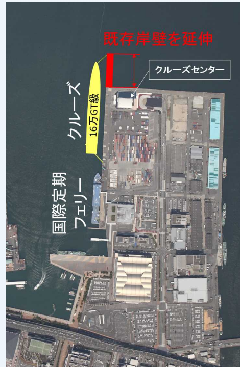
博多港 中央ふ頭（ふ頭左側が西側岸壁）

博多港のホームページによると、「クァンタム・オブ・ザ・シーズ」の中央ふ頭初寄港は5月を予定しているとのこと。