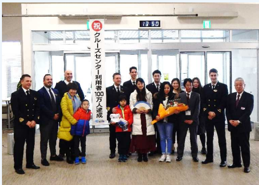
100万人目の利用者(写真中央・白コート)とその家族、関係者ら