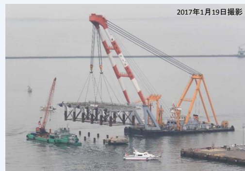
岸壁延伸工事（全景）