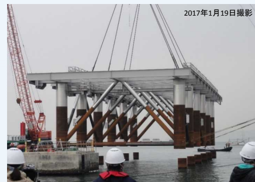
岸壁延伸工事（ジャケット据付）