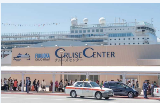
クルーズセンター（中央ふ頭）