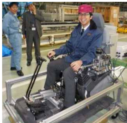
装置設置状態での搭乗状況