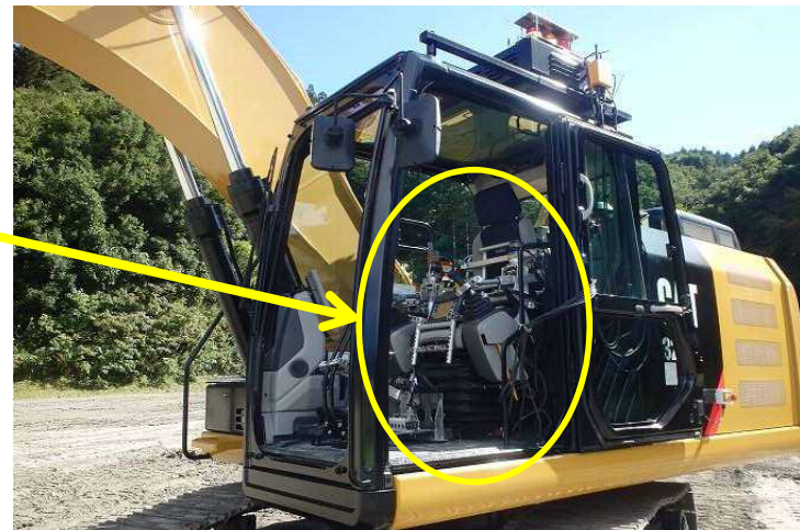
遠隔操縦装置の設置状況