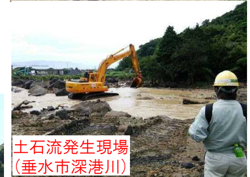
遠隔操縦による復旧作業例