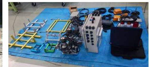
遠隔操縦装置の分解状況