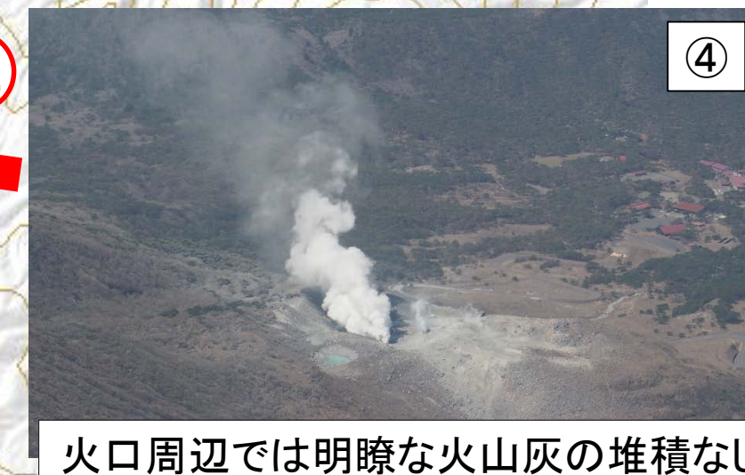
火口周辺では明瞭な火山灰の堆積なし