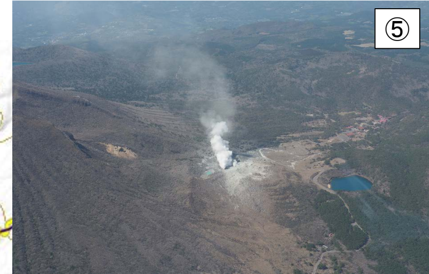
硫黄山から2kmの範囲 (規制区域)