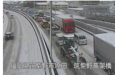
▲国道3号(筑紫野市原田)