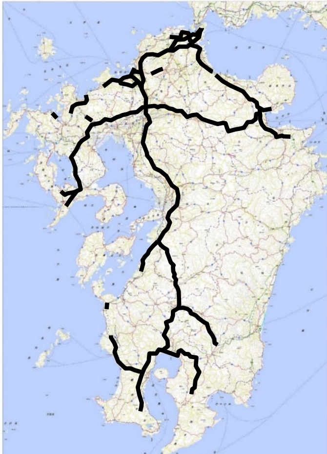
▲平成28年1月の大雪時における通行止状況