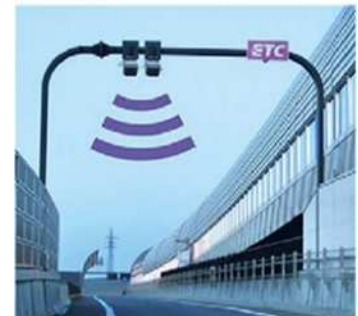
ETCフリーフローアンテナ

佐々IC～佐世保大塔IC間では、ICの出入口に設置するETCフリーフローアンテナにより、ETC無線通信で走行区間を判別します。 高速道路の通行中はETCカードをETC車載器から抜かないでください。