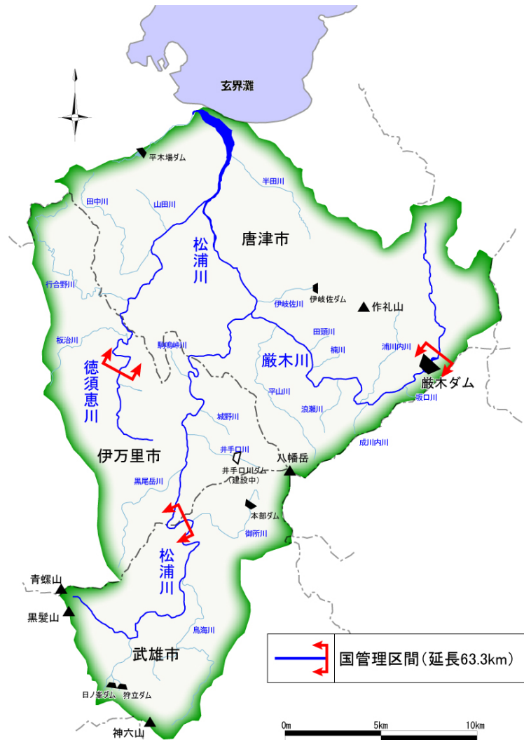
図 3.2.1 松浦川水系河川整備計画対象区間