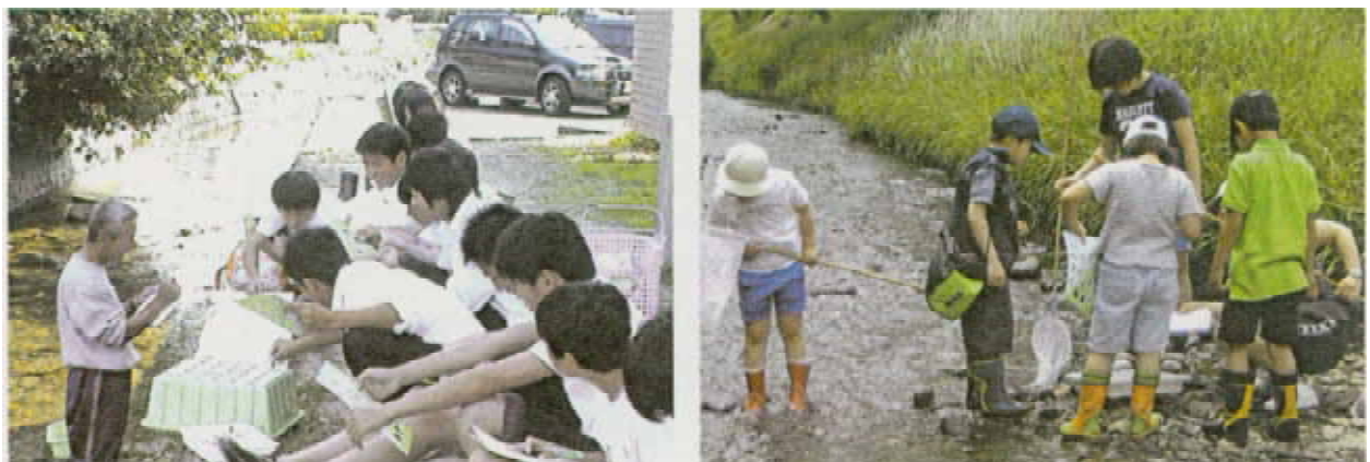
第一回身近な水環境の全国一斉調査の様子(平成16年6月6日)

泊、塚本、南 TEL: 0952-23-5151 FAX: 0952-23-5193 国土交通省武雄河川事務所内