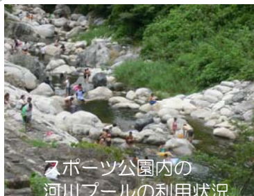
スポーツ公園内の河川プールの利用状況