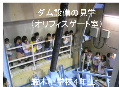
ダム設備の見学（オリフィスゲート室）

6月に厳木小学校、7月に七山わんぱく塾、厳木老人会をはじめとする多くの方々が見学に来られました。