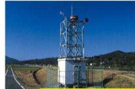
サイレンを鳴らして

サイレンを鳴らす警報所はダムの下流から松浦川との合流点までに11カ所設置しています。