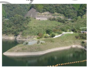
さよの湖に突き出た中央公園からは、湖内を一望することができます。