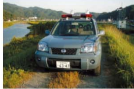
パトロールカーを使って

ダムから放流を始めるときには、サイレンを鳴らしたり、パトカーで巡視をして、まわりの人へ知らせます。