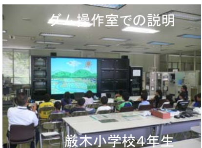
ダム操作室での説明