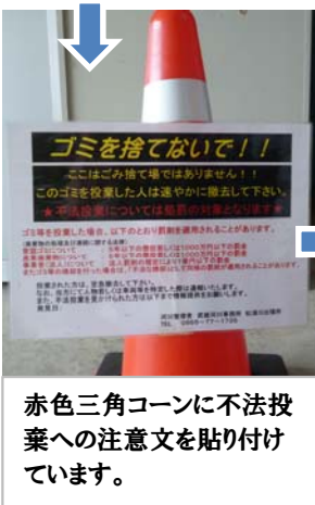
赤色三角コーンに不法投棄への注意文を貼り付けています。