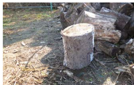
長さ30cm、直径15cm程度の伐木の様子