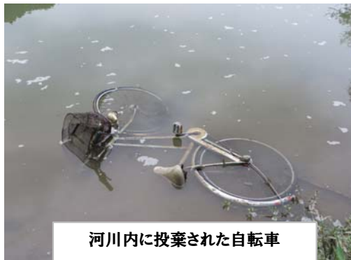
河川内に投棄された自転車