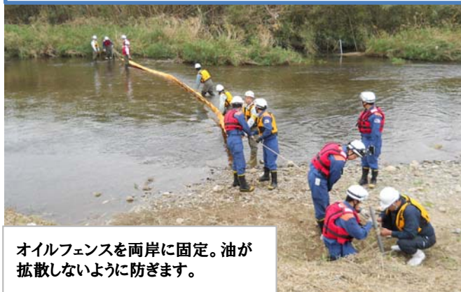
オイルフェンスを両岸に固定。油が拡散ないように防ぎます。

10月29日に唐津市相知町にある相知交流文化センター前の巖木川において、国、佐賀県、唐津市等の関係機関が合同で訓練を実施しました。河川へ油が流出した場合、迅速な対応により被害の拡大防止を目的としています。