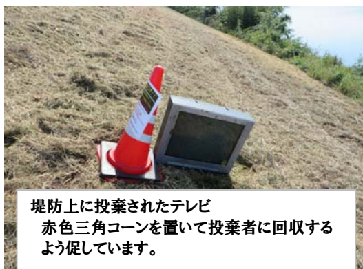
堤防上に投棄されたテレビ 赤色三角コーンを置いて投棄者に回収するよう促しています。

今も家庭からでる多くのごみが河川(松浦川・巖木川・徳須恵川)に投棄されています。その現状についてお知らせします。