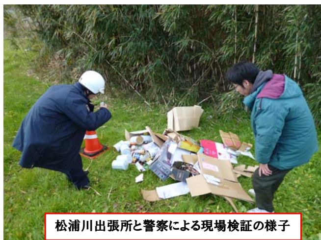
松浦川出張所と警察による現場検証の様子

河川内においては現在もごみを不法に投棄する行為があとをたちません。投棄者の身元が判明するものを調査し、警察、市役所と協力しながら、再発防止に努めています。