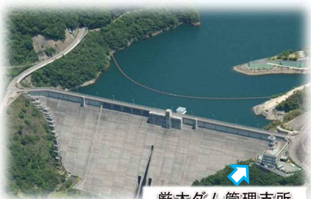
厳木ダム管理支所