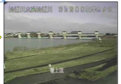
水位等の情報をご覧いただけます。