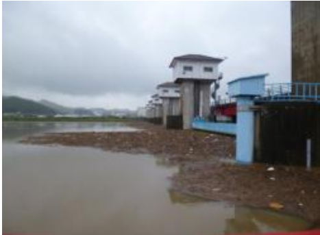
ゴミが集まっている様子です。

松浦大堰での流木や家庭ゴミなどの収集量は、平成25年度には年間約330m 3 、同じく26年度には約220m 3 でした。今回の出水による収集量は約240m 3 で、昨年度の収集量を1回で超えました。松浦川出張所では迅速に回収を行っておりますが、収集するゴミは膨大な量で、中にはタイヤや家庭ゴミも見受けられます。ゴミの不法投棄防止への地域の皆さん方のご理解、ご協力をお願いいたします。